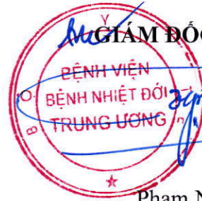
Phạm Ngọc Thạch