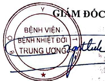
Phạm Ngọc Thạch