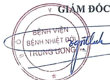
Phạm Ngọc Thạch