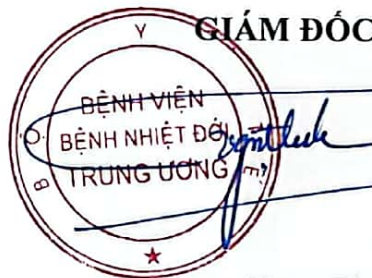
Phạm Ngọc Thạch